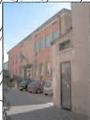
> 3_ripresa fotografica