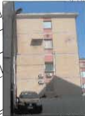
> 6_ripresa fotografica