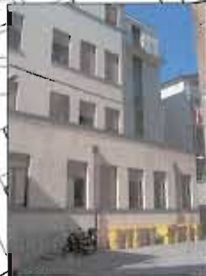
> 5_ripresa fotografica