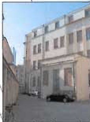
> 4_ripresa fotografica