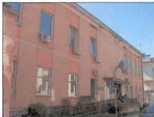
> 2_ripresa fotografica