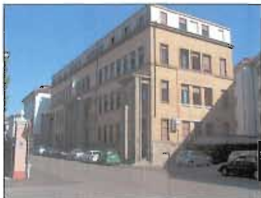
> 1_ripresa fotografica

Prescrizioni: gli interventi dovranno mirare alla qualità architettonica e alla qualità costruttiva e tecnologica per ottenere un basso impatto ambientale e massimizzare il risparmio energetico. Particolare attenzione dovrà essere posta nella sistemazione degli spazi di pertinenza dei fabbricati.