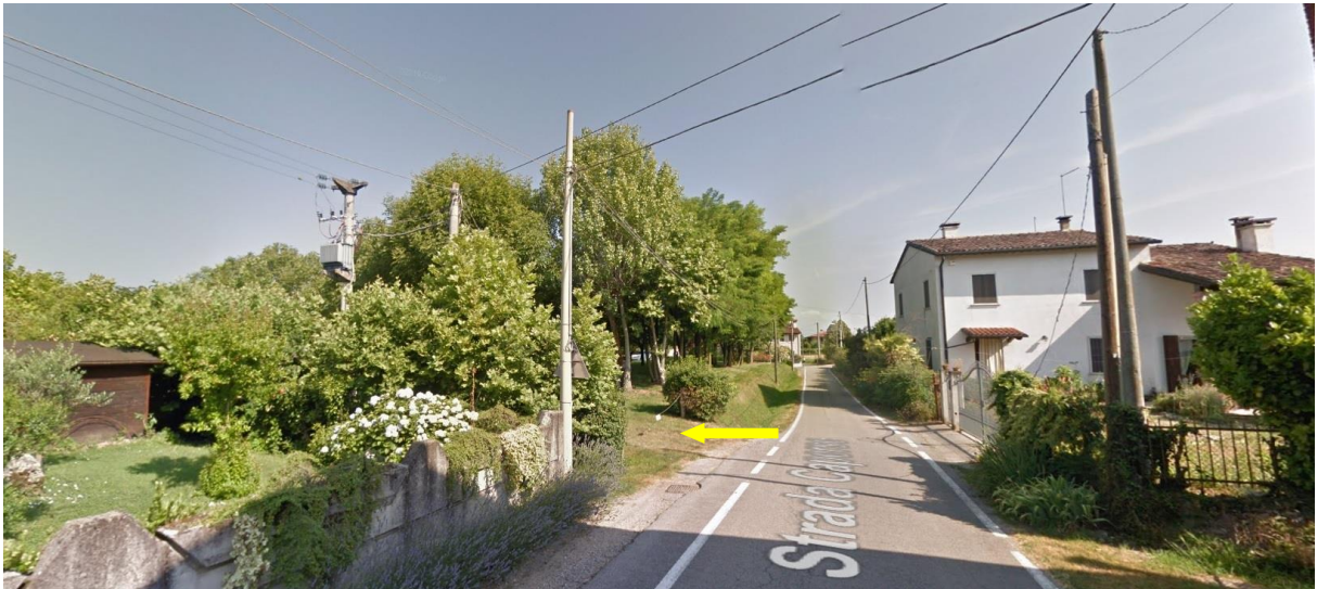
Vista dell'ingresso esistente al terreno agricolo in oggetto di PUA da via Ca' Perse