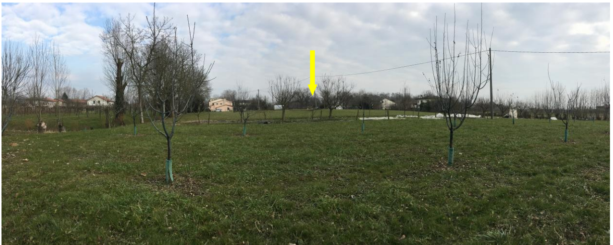
Vista dall'angolo nord-ovest del lotto di proprietà, dal fondo della proprietà oltre l'area di interesse