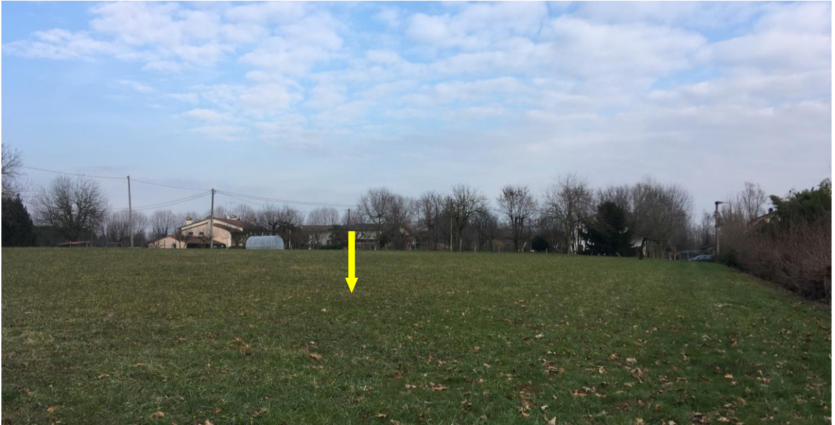
Vista dall'angolo sud-ovest del lotto, in questa posizione la quota del terreno è praticamente la stessa della strada esistente.