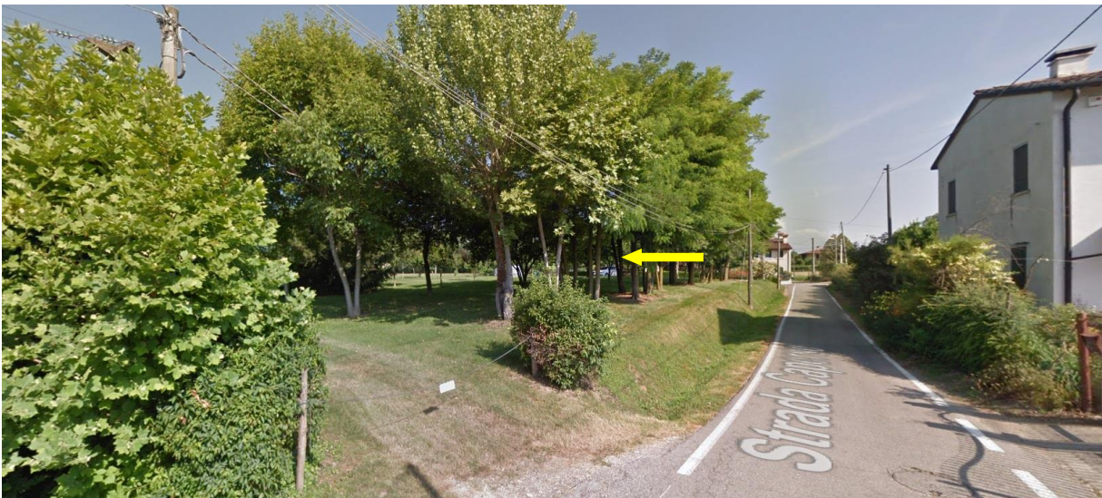
Vista dell'ingresso esistente al terreno agricolo in oggetto di PUA da via Ca' Perse