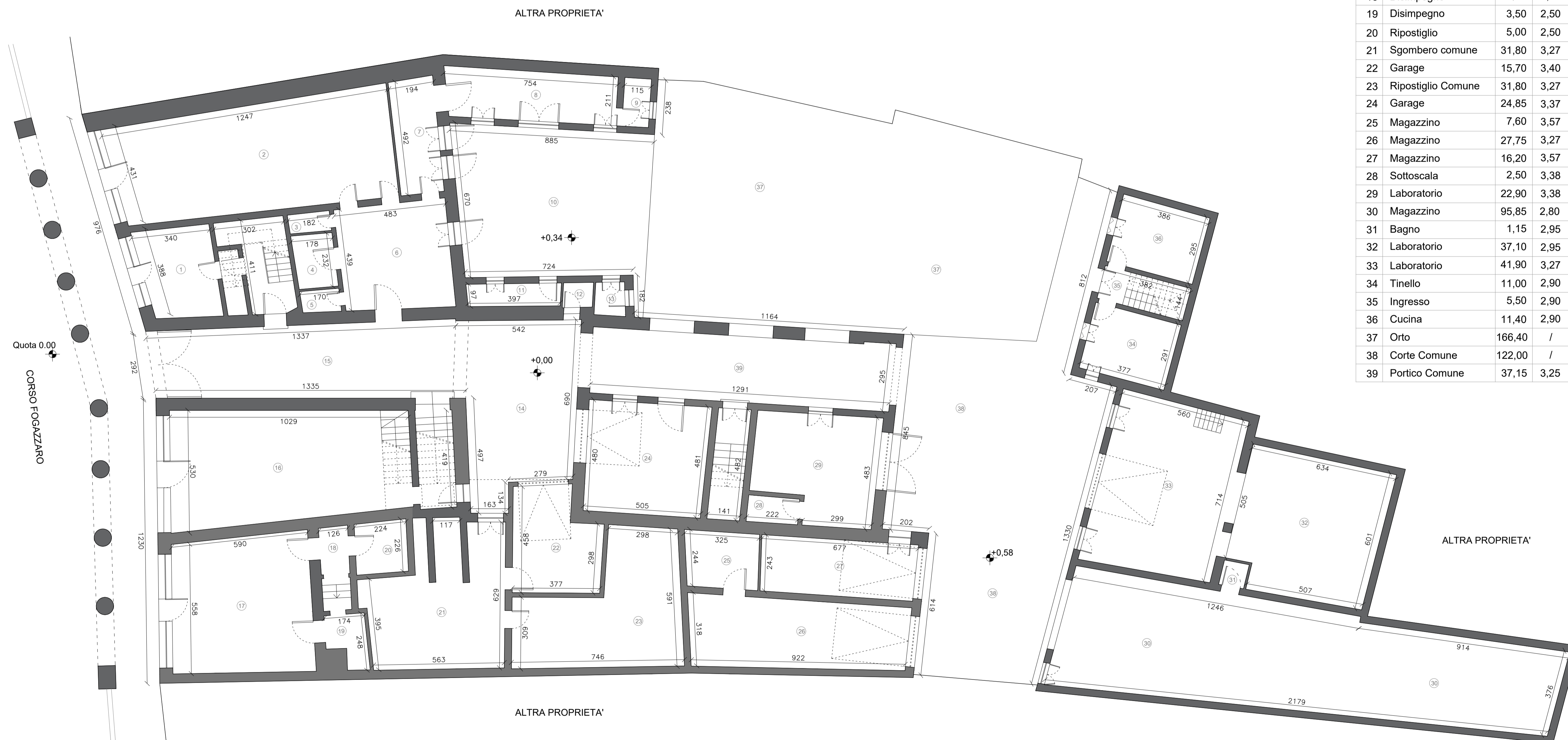
SCALA GRAFICA 1:100