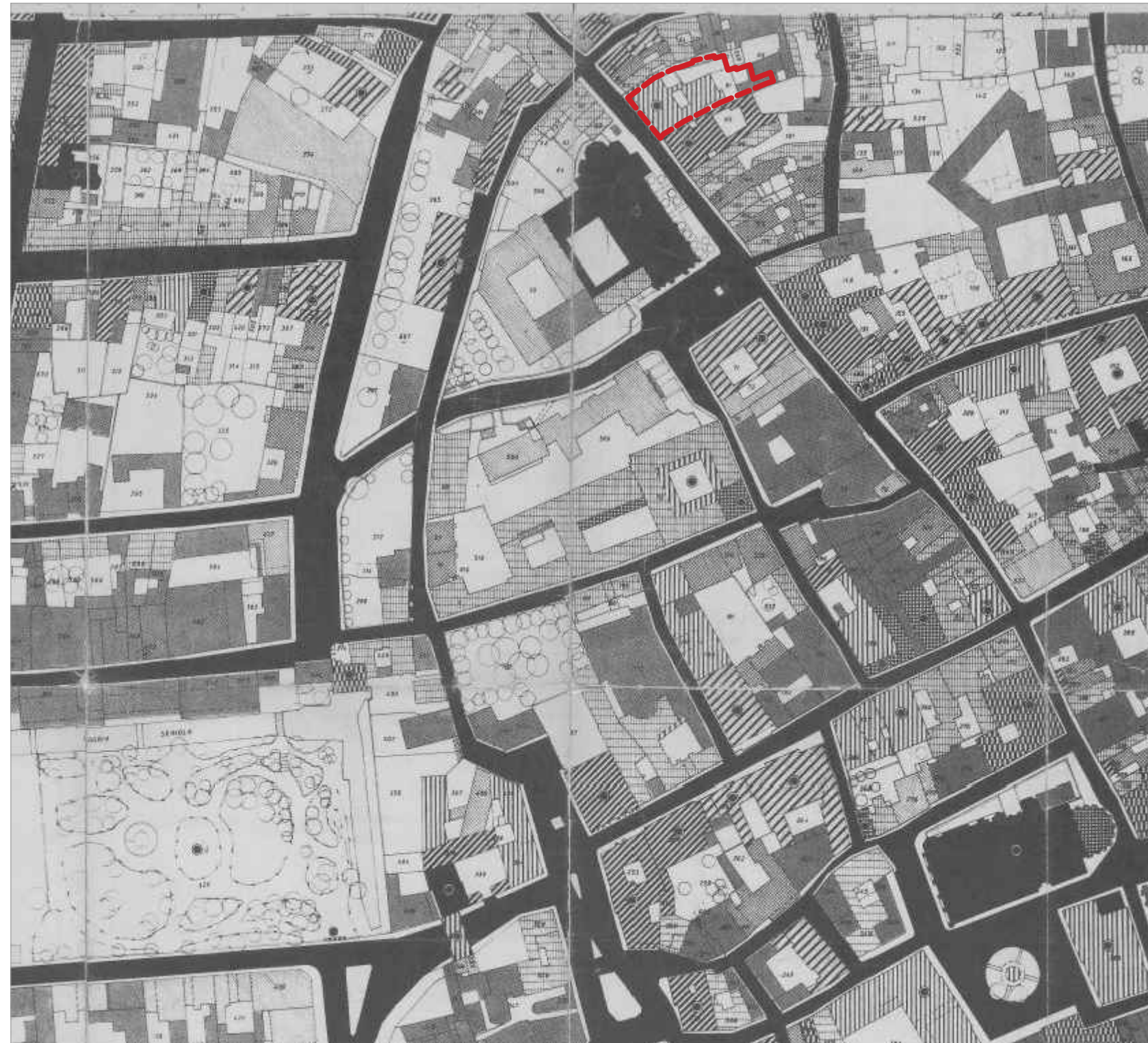
Estratto P.P.C.S. - piano Coppa - scala 1:2000