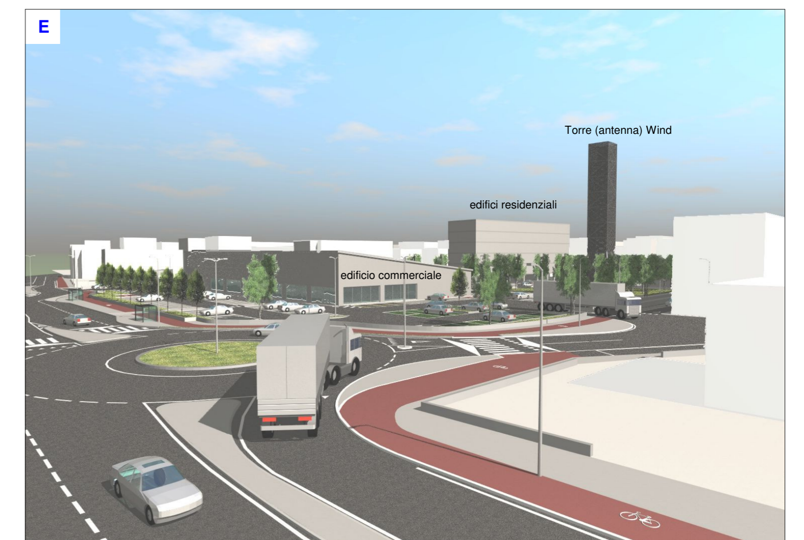
Vista dell'incrocio tra viale della Pace e via Bortolan