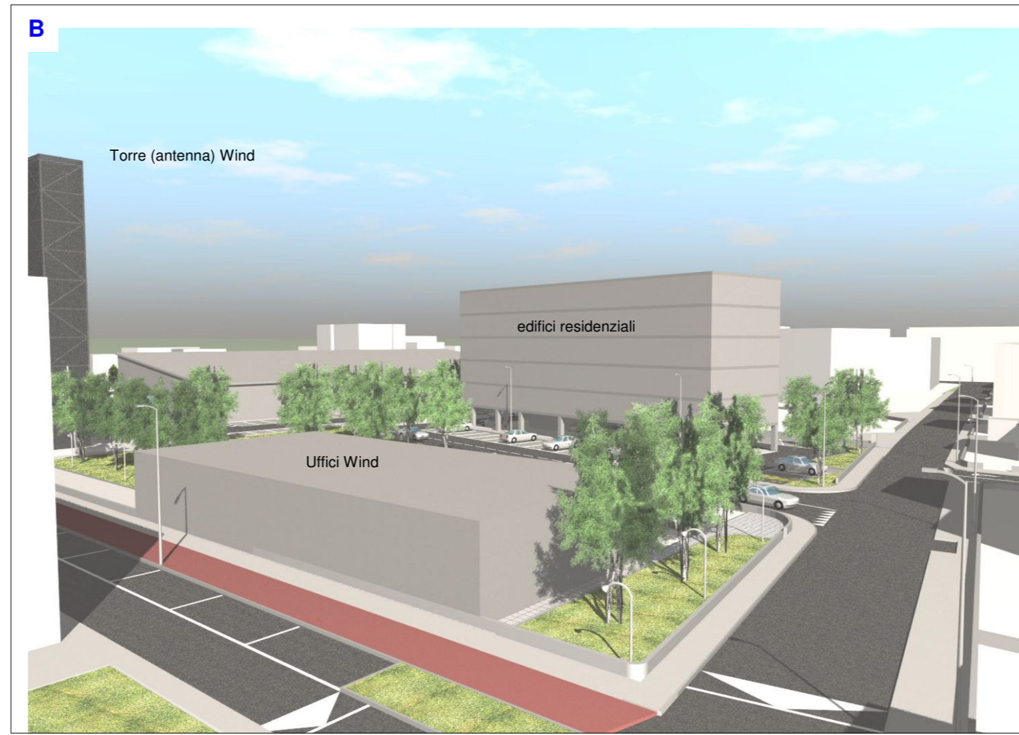
Vista dei fabbricati direzionale e residenziali da via Rumor