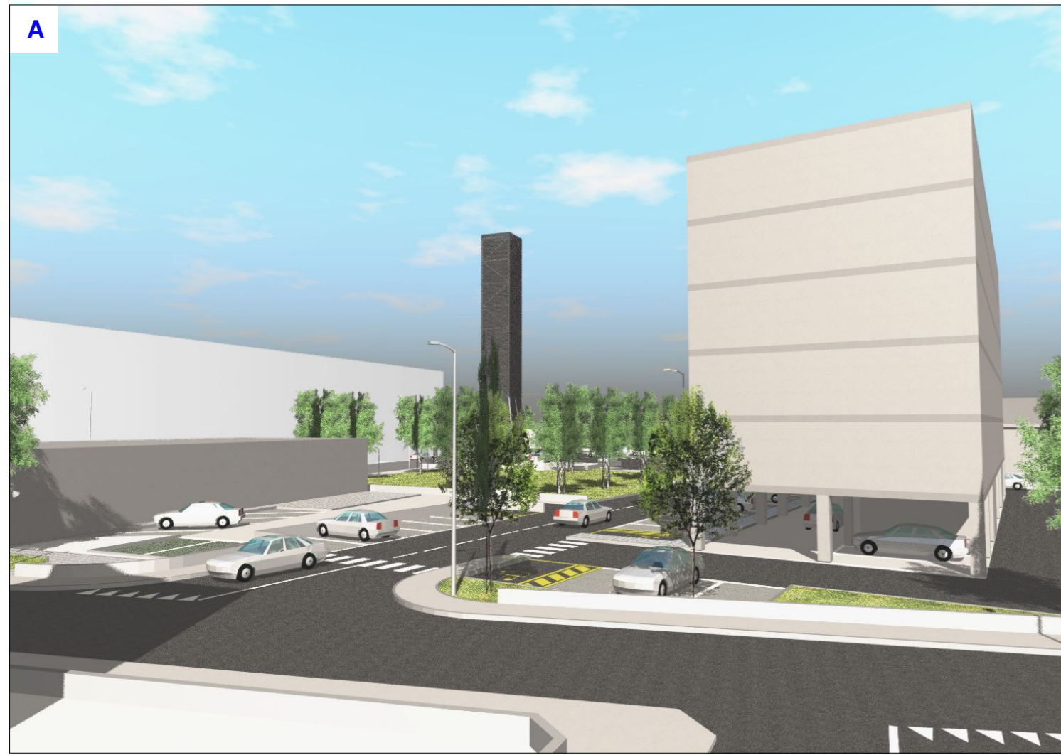
Vista dei fabbricati residenziali da via Rumor