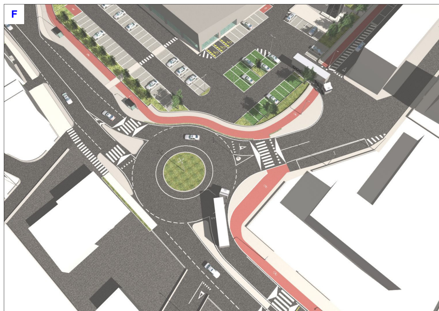
Vista della nuova rotondina in viale della Pace