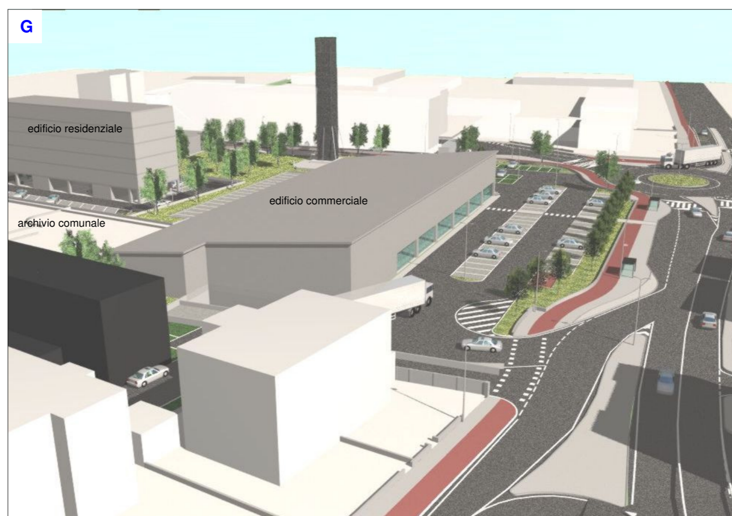
Vista della nuova rotondina in viale della Pace