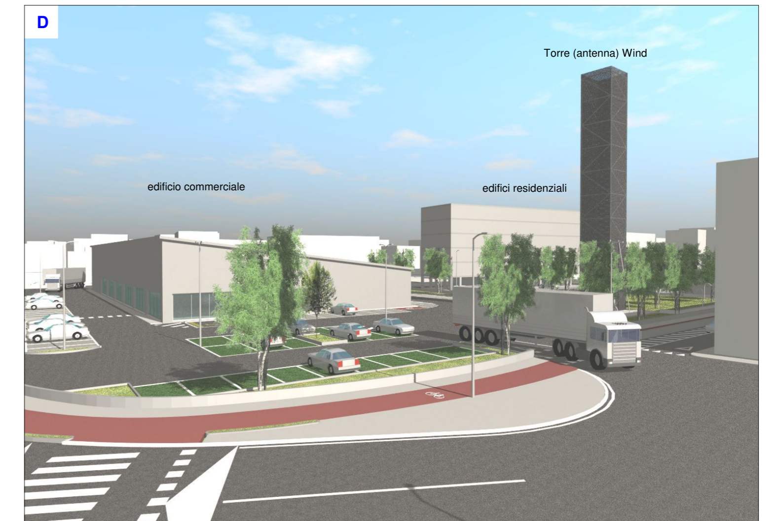
Vista dell'uscita di via Bortolan