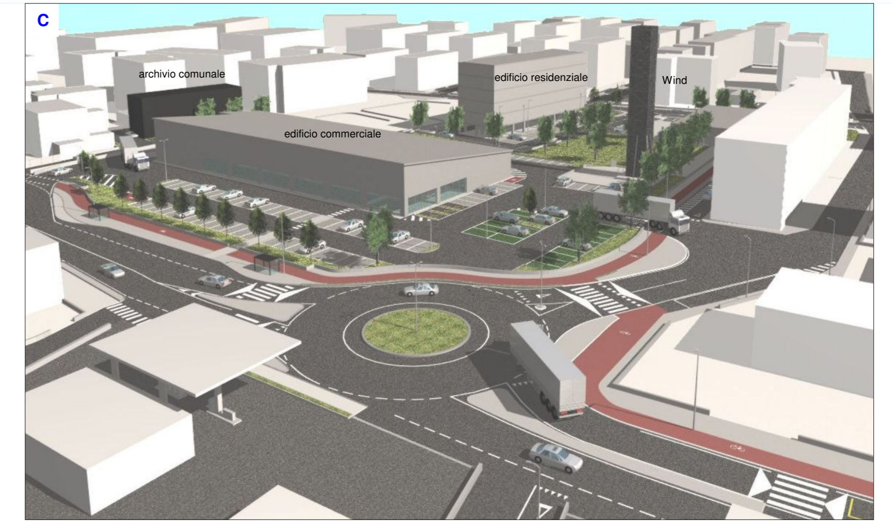
Vista area generale da viale della Pace