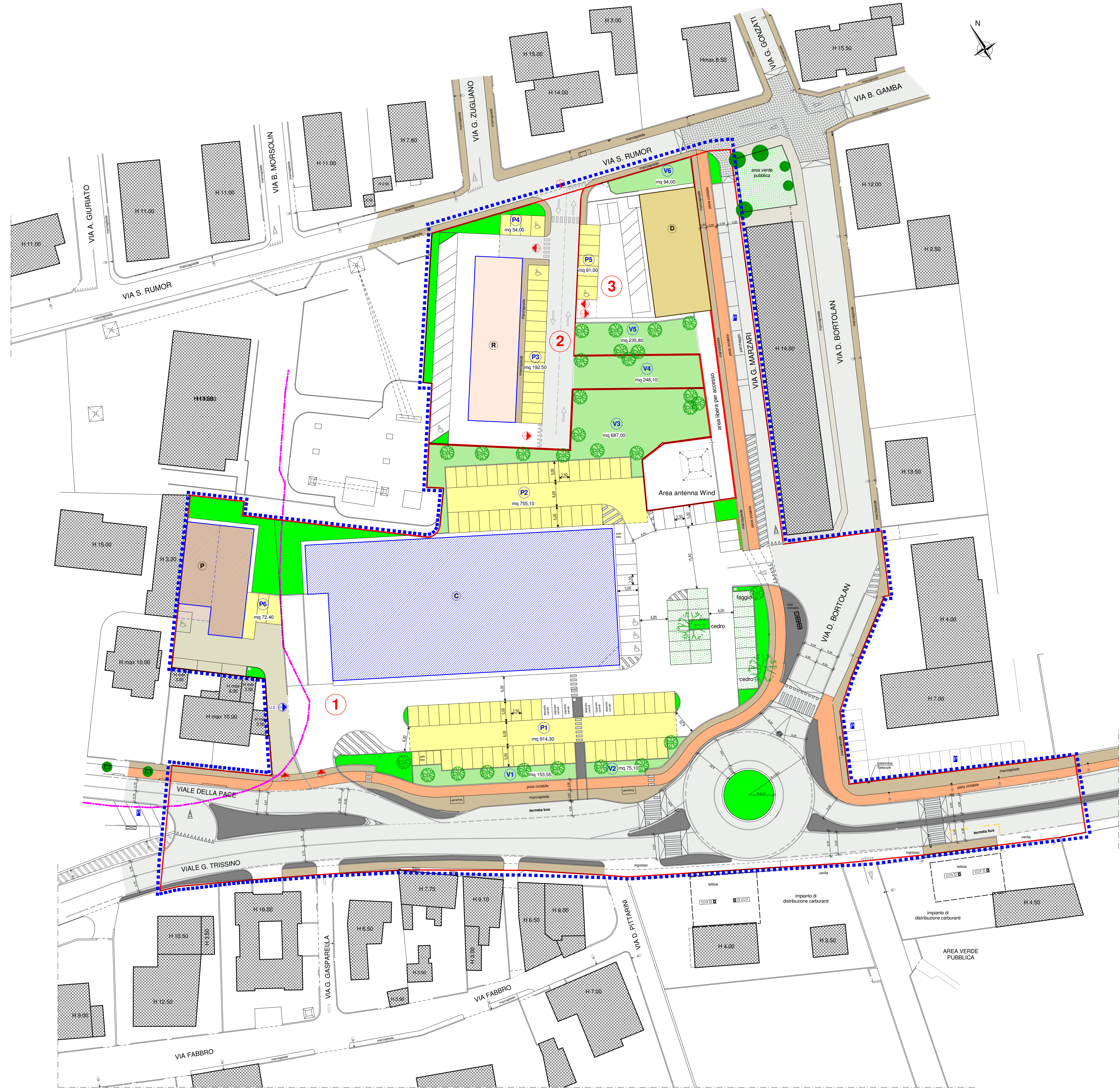
PLANIMETRIA GENERALE 1:500 - individuazione aree a standard pubblico