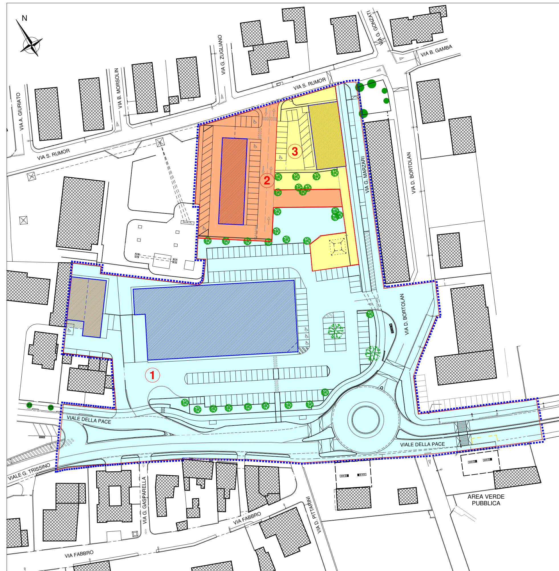
Planimetria generale 1:1000 - individuazione delle unità minime di intervento