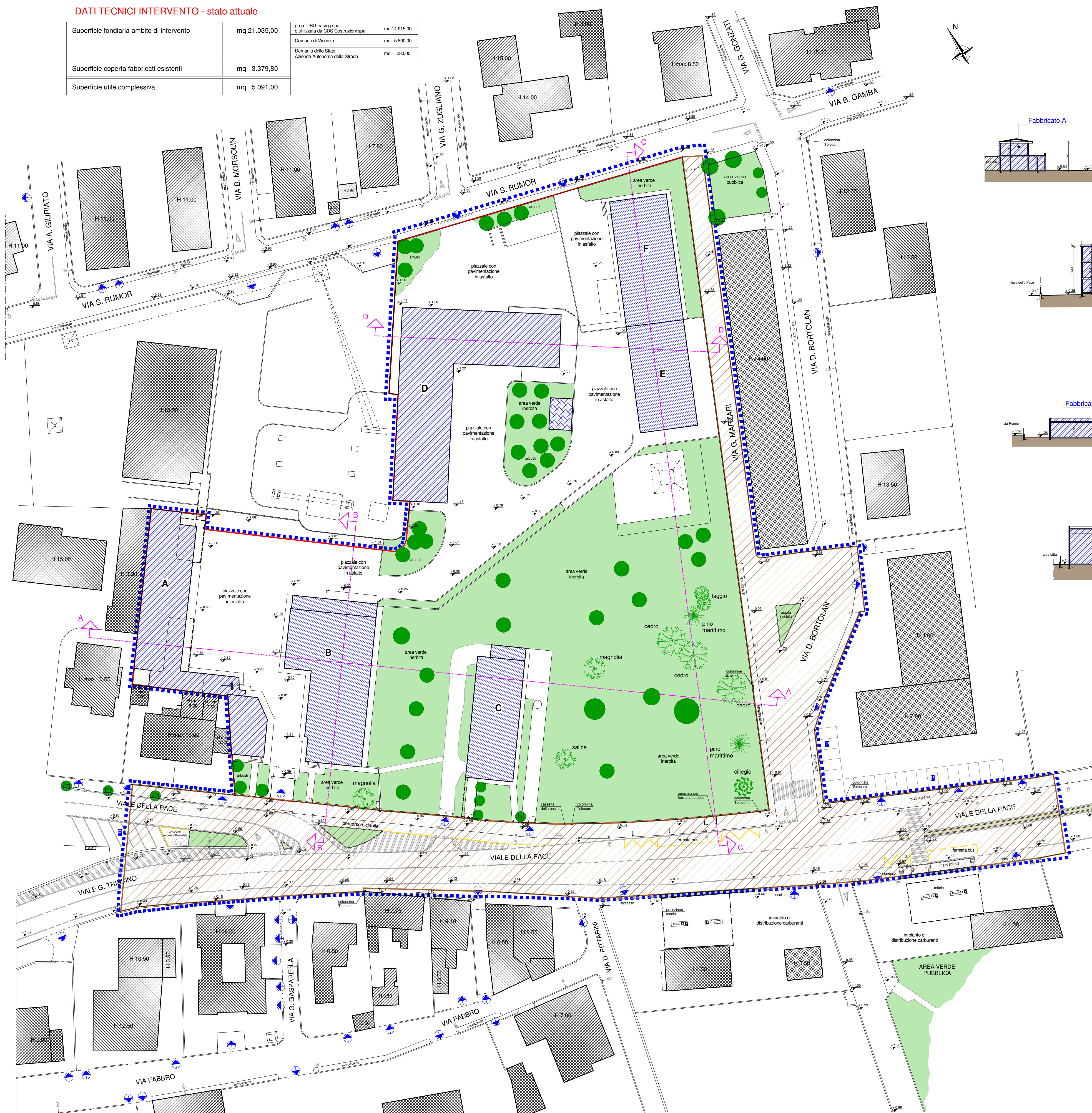
PLANIMETRIA GENERALE 1:500 - stato attuale