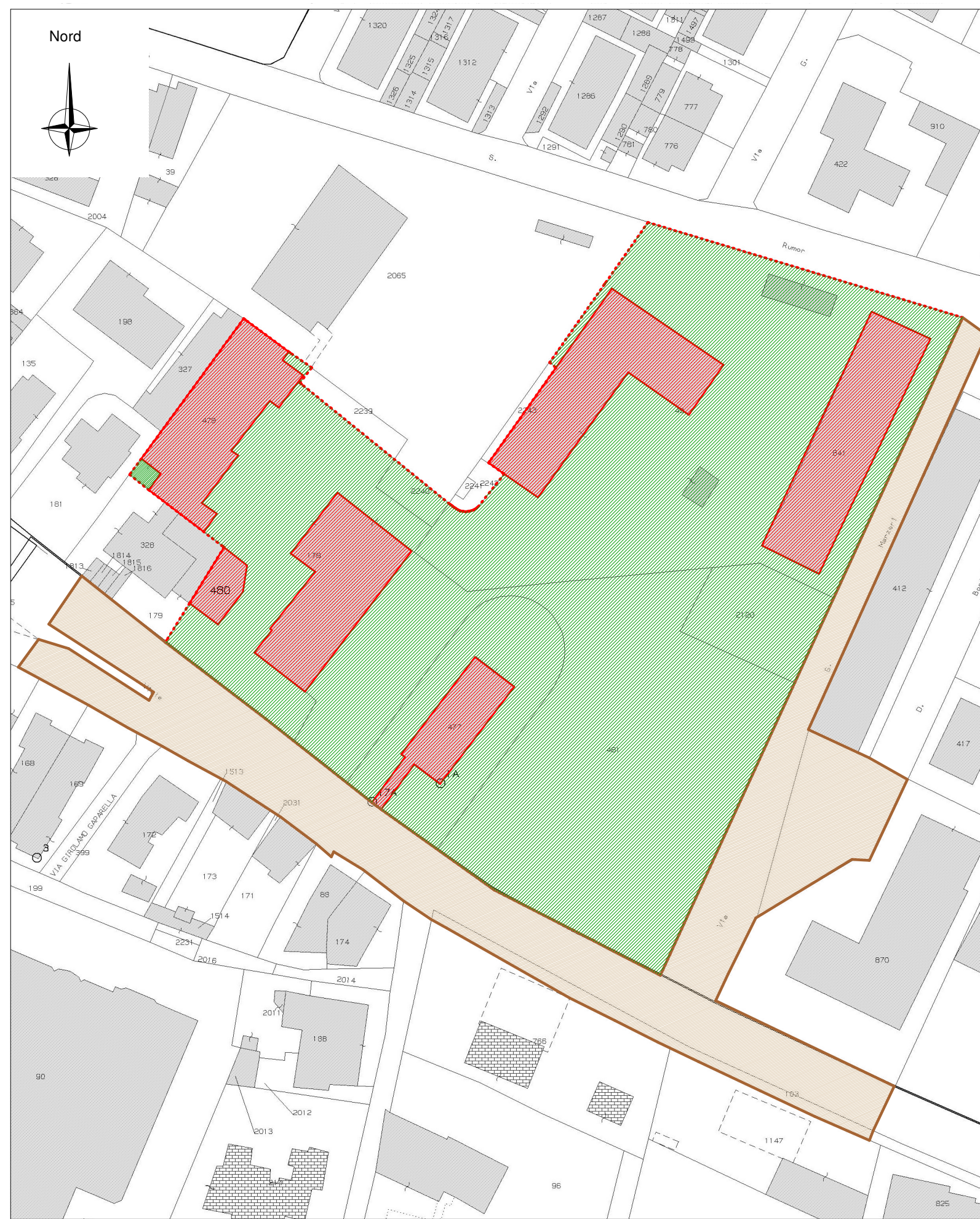
ESTRATTO DI MAPPA CATASTALE - 1:1000 area proprietà