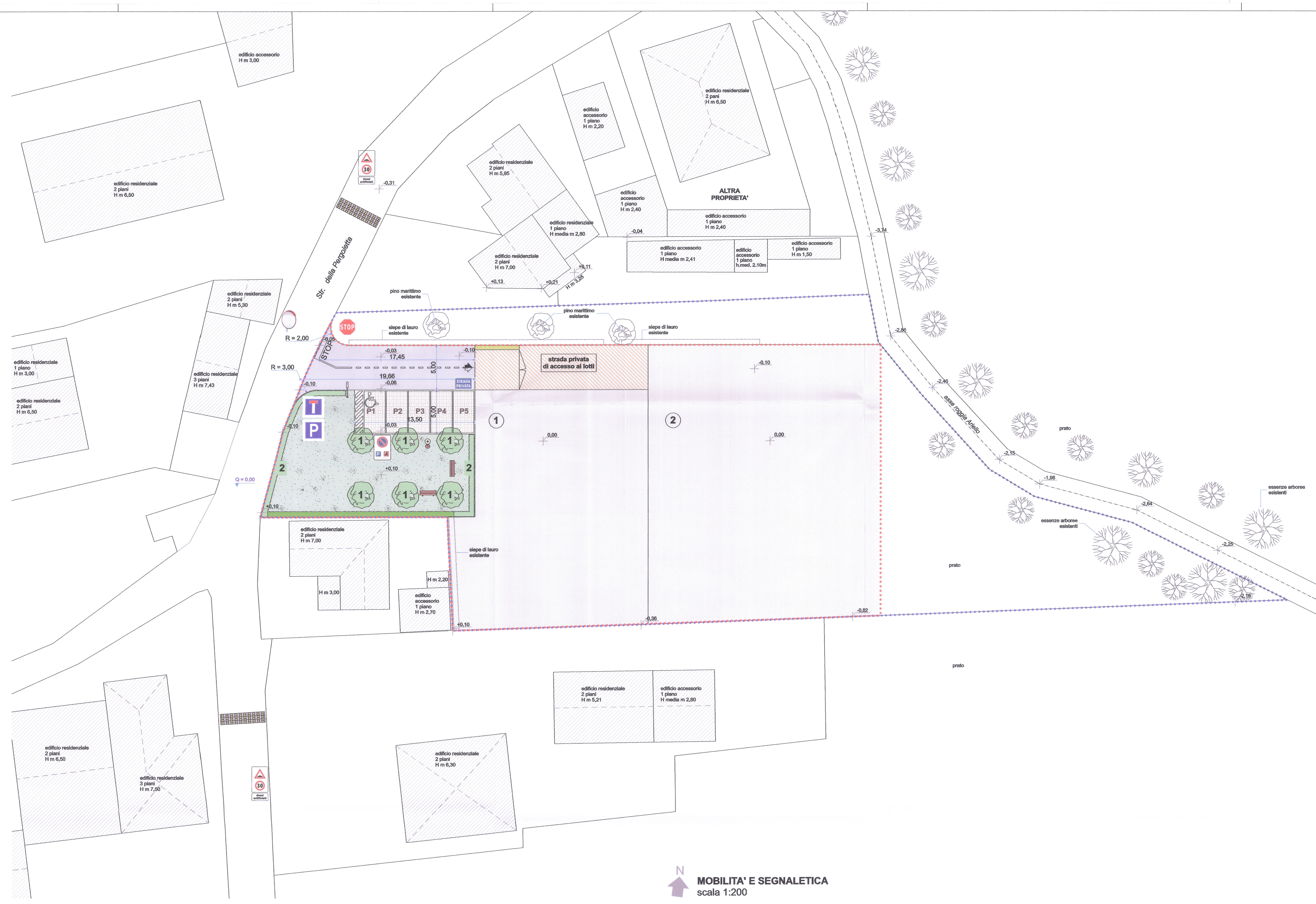
MOBILITA' E SEGNALETICA scala 1:200